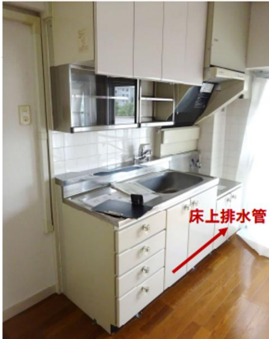
圖 1 系統廚具(注意照片示意排水管方向)

照片中「床上排水管」之「床上」意指同層(當層)，「床上排水管」字眼箭頭方向，意指系統廚具的內側位置，設置採用樓板上方的同層排水。廚具水槽下內側設置牆前式排水管道，採直接貫穿外牆連通至外側服務陽台的垂直管道間主立管。