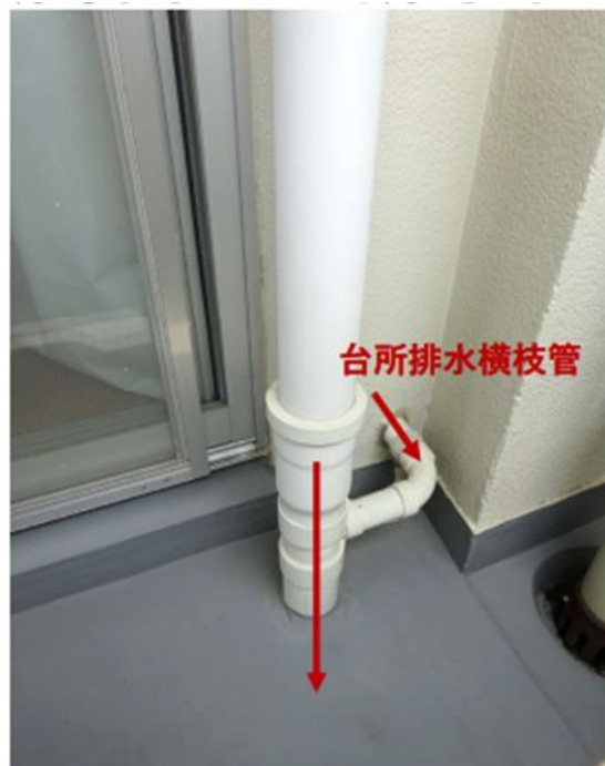
圖 2 服務陽台上垂直管道(注意排水方向)

照片中「床上排水管」之「床上」意指同層(當層)，「床上排水管」字眼箭頭方向，意指系統廚具的內側位置，設置採用樓板上方的同層排水。廚具水槽下內側設置牆前式排水管道，採直接貫穿外牆連通至外側服務陽台的垂直管道間主立管。